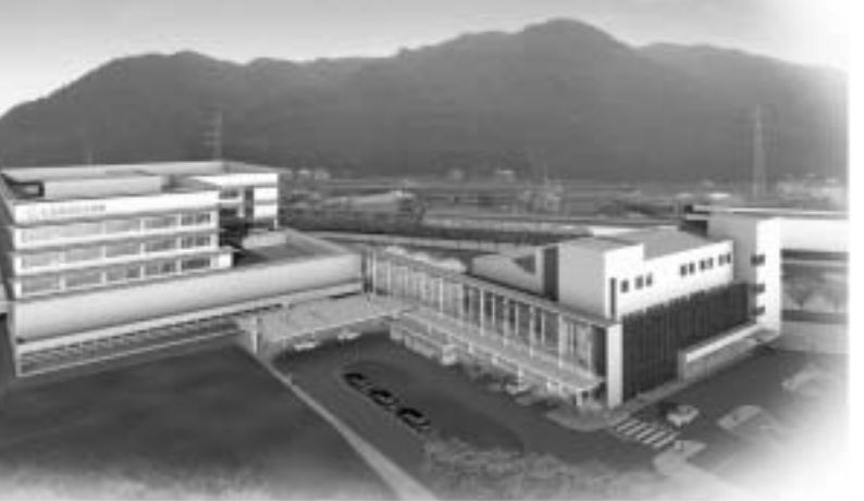
北側から見た完成予想図

既存4棟のうち、耐震基準を満たしている南病棟は改修し、健診センターや訪問看護ステーションなどを設けます。 今年度は工事発注のために必要となる実施設計のほか、建築の準備工事として、既存施設等の解体工事や建設用地の一部となる造成工事などを実施します。その後、平成22年度と23年度の2年間で病院本棟の建築工事を行い、平成24年4月に、高島