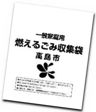
高島市ごみ袋一般用(大)