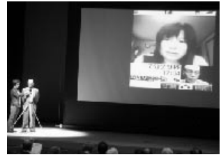
テレビつき携帯電話で通話されました